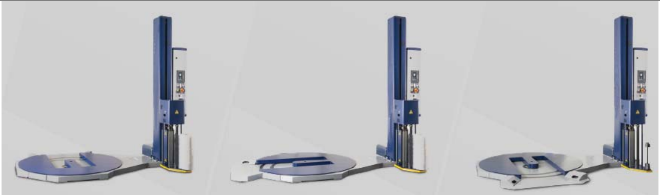
SX Side Load