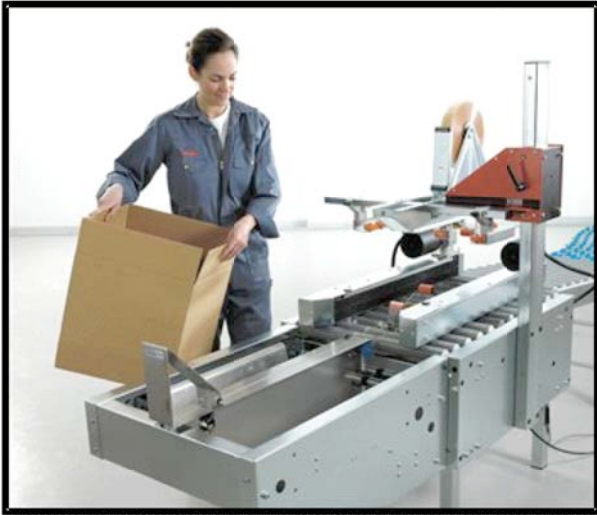
Der Karton wird geöffnet.