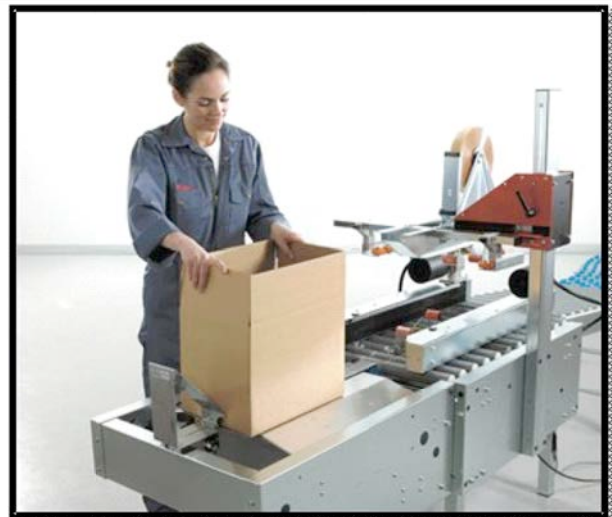
Der Karton wird festgehalten und kann nun befüllt werden. Im Anschluss wird der Karton durch einen pneumatischen Vorschub weiterbefördert.