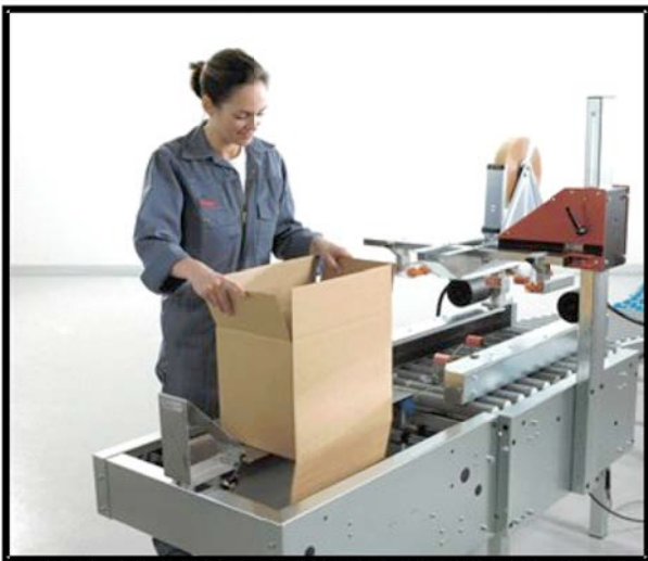
Der Karton wird zur Schiene geführt und anschließend werden die Seitenklappen auf der Unterseite gefaltet.