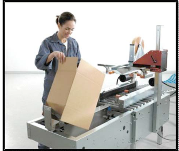
Die vordere und hintere Klappe werden in Richtung Schiene gefaltet.